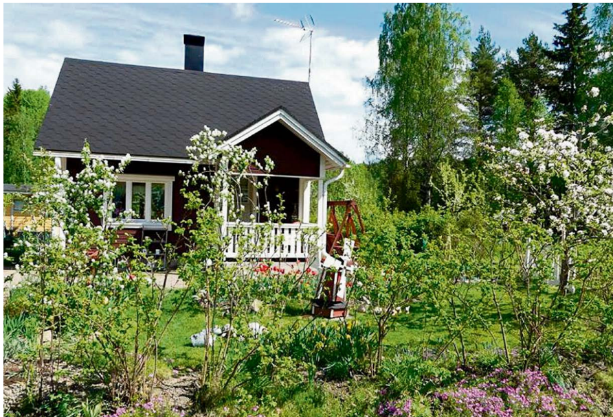
Siirtolapuutarha on puutarhavihlykseen varattu alue, joka on jaettu keskimäärin 250-500 neliön suuruisiin palstoihin.

- Kannattajat ovat hyvin tärkeä osa jääkiekkoa. Kanada-malja kuuluu